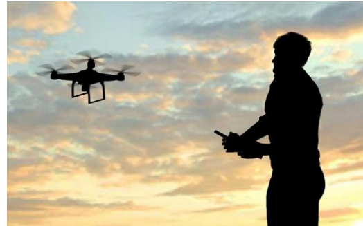
Gambar 1, Sistem kendali drone Visual Line of Sight (VLOS)

Sistem pengendalian drone di Indonesia saat ini sebagian besar adalah Visual Line of Sight (VLOS), dimana drone harus selalu terlihat secara langsung oleh pilot tanpa alat bantu, dan drone dikendalikan secara langsung menggunakan remote control , dimana sinyal kendali dan informasi (data maupun gambar) dipertukarkan antara drone dengan remote control melalui transmisi radio. Dengan sistem kendali VLOS ini jangkauan terbang drone menjadi terbatas, yaitu: hanya sejauh 500 meter saja dari pilot, jika tanpa penghalang pandangan, atau lebih dekat lagi jika terdapat banyak penghalang pandangan [4] .